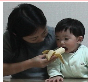
食物を介し、母子は発達に応じたさまざまなやりとりをする。

周りの人が深く長く子どもに関わりつづける食のスタイルは、人間に固有です。こうした食の特徴は、人間の進化と深く関わっているといわれています。子どもの食発達を理解することは、大人の食、そして人間を知ることにもつながります。「発達」と「進化」の視点から人間の本質を理解し、社会での実践につなげることをめざします。